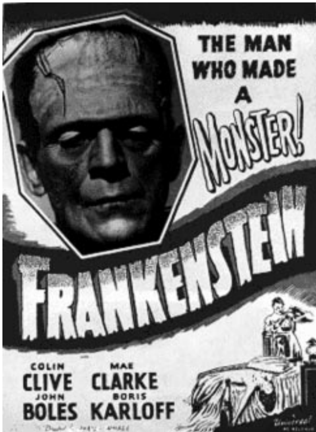
Cartel del 'Frankenstein' de James Whale de 1931.

Los más diversos cataclismos de nuevo tipo (en los últimos veinte años hubo, por ejemplo, alrededor de mil mareas negras y más de 180 accidentes químicos graves, que costaron la vida a unas 8.000 personas y