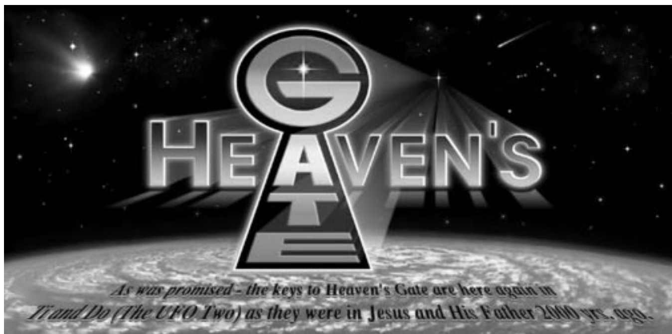
Imagen de la 'web' de la secta suicida Puerta del Cielo.

dieron también, en noviembre de 1987, los notables católicos de una ciudad italiana. Hicieron celebrar al cura local una misa solemne a fin de conjurar la caída en las cotizaciones 2 . ¿Cómo no dirigir los ojos a Dios cuando todo se hunde alrededor de uno? ¿Cuando las propias ciencias económicas se revelan incapaces de aportar correcciones lógicas a las furiosas desreglamentaciones de la economía mundial? Desreglamentaciones y distorsiones que los especialistas no dudan en calificar de irracional es.