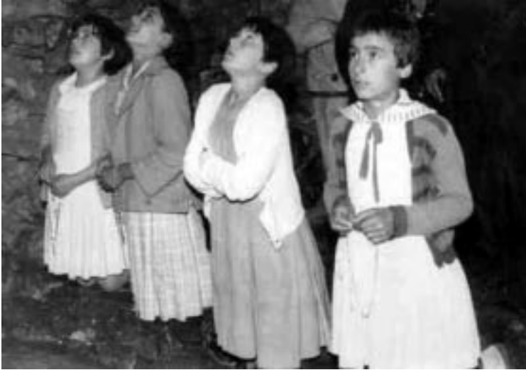
Las niñas de Garabandal en uno de sus éxtasis marianos.