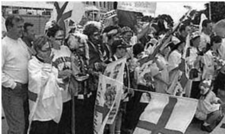
El fútbol levanta pasiones desaforadas en todo el mundo.

Hay asociaciones que predicán también el desarrollo de las prácticas deportivas con el fin de formar mejor a los jóvenes para los retos que les esperan en el seno de los ejércitos que participan en las conquistas colo-