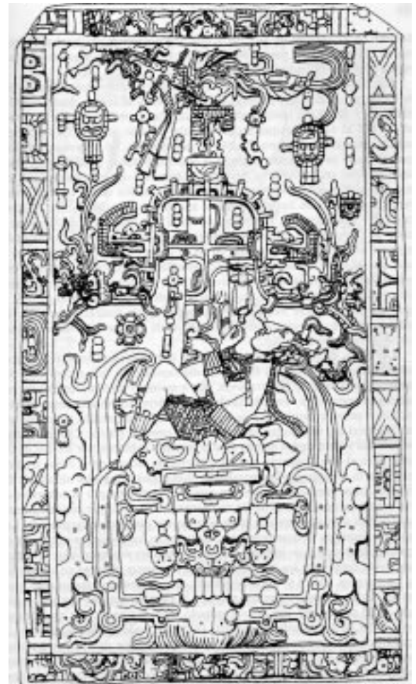
Fotografía y dibujo de la losa que cubría el sarcófago de Pacal, en Palenque (según Fiedel).