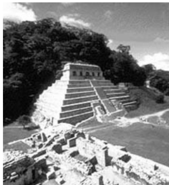
El templo de las Inscripciones

una serpiente bicéfala en sus ramas claramente visible, de cuyas fauces surge un dioscecillo, y con un pájaro en su rama superior.