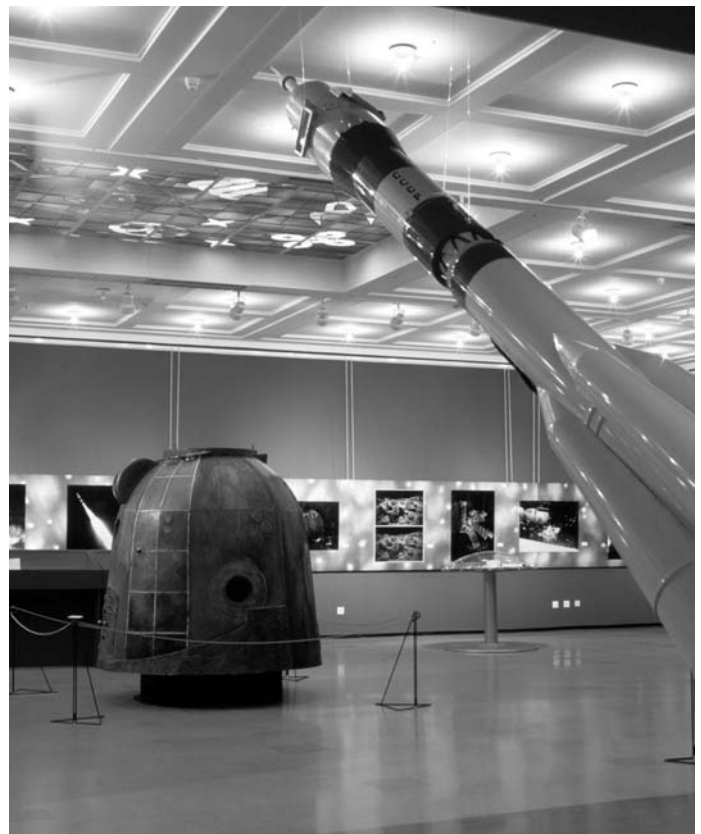
La exposición SPUTNIK en Pamplona. Entre las supuestas pruebas del viaje de Istochnikov se incluía también la cápsula.