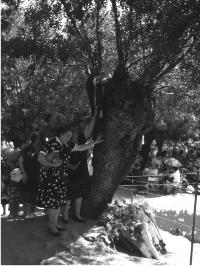
Pradonuevo en julio de 1990: fieles ante el fresno de la aparición mariana.

te de la Fundación Pía. “Ellos creen que están salvando al mundo, pero sólo les utilizan como fuente de financiación y mano de obra gratuita. Son ellos los que cuidan a los ancianos en las residencias que tienen. Les tratan como a esclavos”, afirmaba Bueno a El País el pasado 7 de julio. Ellos esperan conseguir más casos y demostrar en los juzgados estas prácticas.