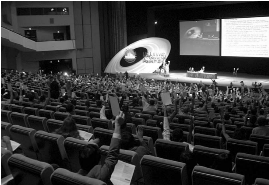
Votación sobre la nueva definición de planeta en la XXCVI Asamblea General de la Unión Astronómica Internacional en Praga.

de los aspectos de Plutón con los otros planetas. El descubrimiento de Caronte, una luna casi la mitad de tamaño de este planeta tampoco afectó a los astrólogos.