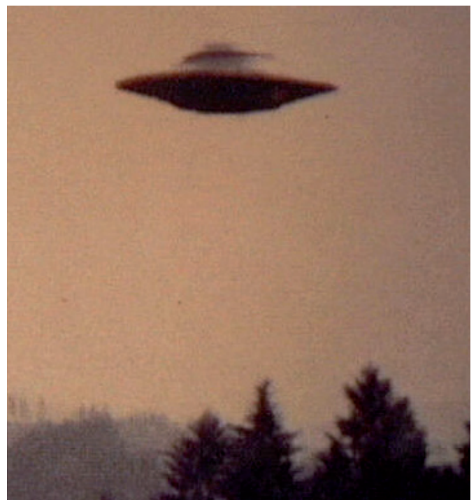
Fotografía antigua de un ovni. [Archivo]

Hoy, en el siglo XXI, ya no se habla de estas cosas, el cine ha podido con todo, ya no hay ligeros huevos fritos con luces psicodélicas, ahora son naves nodrizas gigantescas como ciudades que nos mandan alta tecnología, a veces desde complejas bases en el fondo del mar o en la cara oculta de la Luna.