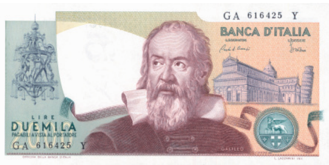
El antiguo billete de 2000 Liras italianas rendía homenaje a Galileo Galilei, dando cuenta de su importancia histórica.

y todo tipo de fantasías plagan su libro, el cual es un alegato a la deriva científica, esa creatividad, esa visión ulterior que debe regir todo intento de descubrir nuevos fenómenos, y que debería ser nutrido de esos mismos fenómenos al ser descubiertos.