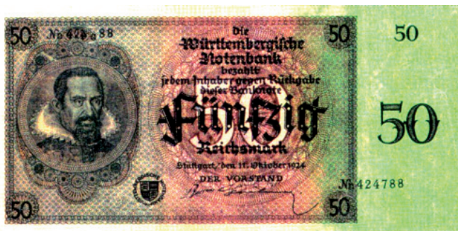
Antiguo billete de 50 Reichsmark alemanes que muestra la figura de Kepler. [Archivo]

Kepler envía una respuesta donde refleja la capacidad creadora, imaginativa y hasta alocada del científico, que ve en un descubrimiento, las puertas abiertas a todo un nuevo universo. Kepler, que en otros trabajos demuestra una adhesión perfecta a la evidencia de los datos como Galileo, en su « Dissertatio cum nuncio sidereo » nos muestra su lado más fantasioso. Las observaciones de Galileo confirman lo que tanto tiempo lleva defendiendo y tratando de demostrar, y en su alegría se deja llevar por la imaginación: selenitas en la Luna, Jovianos de Júpiter