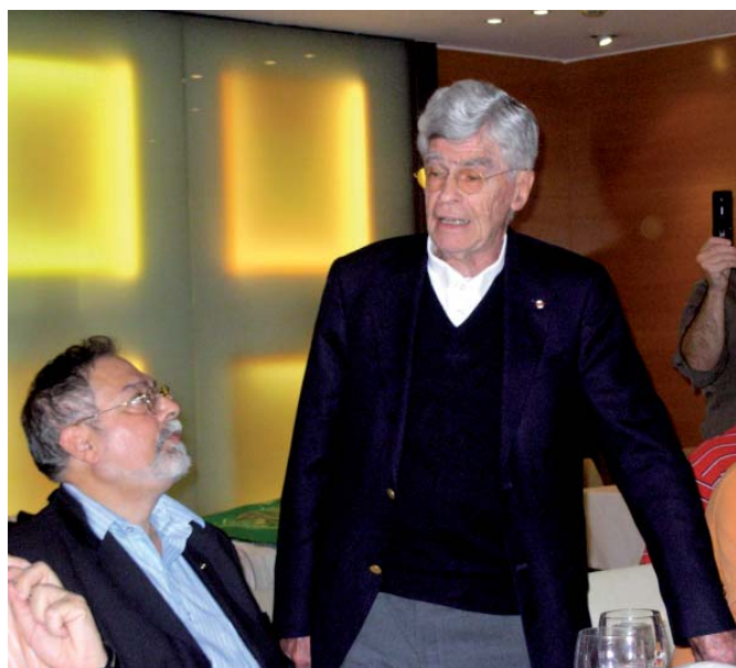
Mario Bunge durante su discurso en la Cena Homenaje de la ARP-SAPC de 2008. Durante el mismo, criticó duramente a Richard Dawkins.

Mario Bunge criticó muy duramente a Richard Dawkins en una cena homenaje de ARP-SAPC en Barcelona y en las Jornadas de Castelldefels. Estas críticas me sorprendieron ya que Dawkins es uno de los científicos más famosos y gran defensor del evolucionismo, por eso le pregunté cuáles eran las razones de sus críticas y la respuesta fue la siguiente: yo estimo mucho las críticas de Dawkins al creacionismo, pero creo que tanto su genética como su memética son fantasiosas, de modo que su compañía no nos da prestigio. He aquí unas pocas de las muchas críticas que merece: (a) al afirmar que la existencia misma de los organismos es paradójica, por ser ellos meros canales de transmisión de los genes, Dawkins descalifica a toda la biología como mero pasatiempo; (b) al afirmar que los genes se autoduplican, Dawkins exhibe su ignorancia de la genética, ya que la división de las moléculas de ADN (a diferencia de las de ARN) es efectuada por enzimas; el enfoque correcto es tomar el supersistema genoma-proteoma; (c) la afirmación de que los genes son egoístas es una mera modernización de la antigua teleología; (d) la afirmación de que las unidades de selección son los genes contradice toda la biología evolutiva, puesto que lo que interactúa con el medio y en particular con otros organismos es el organismo íntegro; de nada le servirá a un vertebrado superior tener su genoma intacto si le cortan las dos extremidades