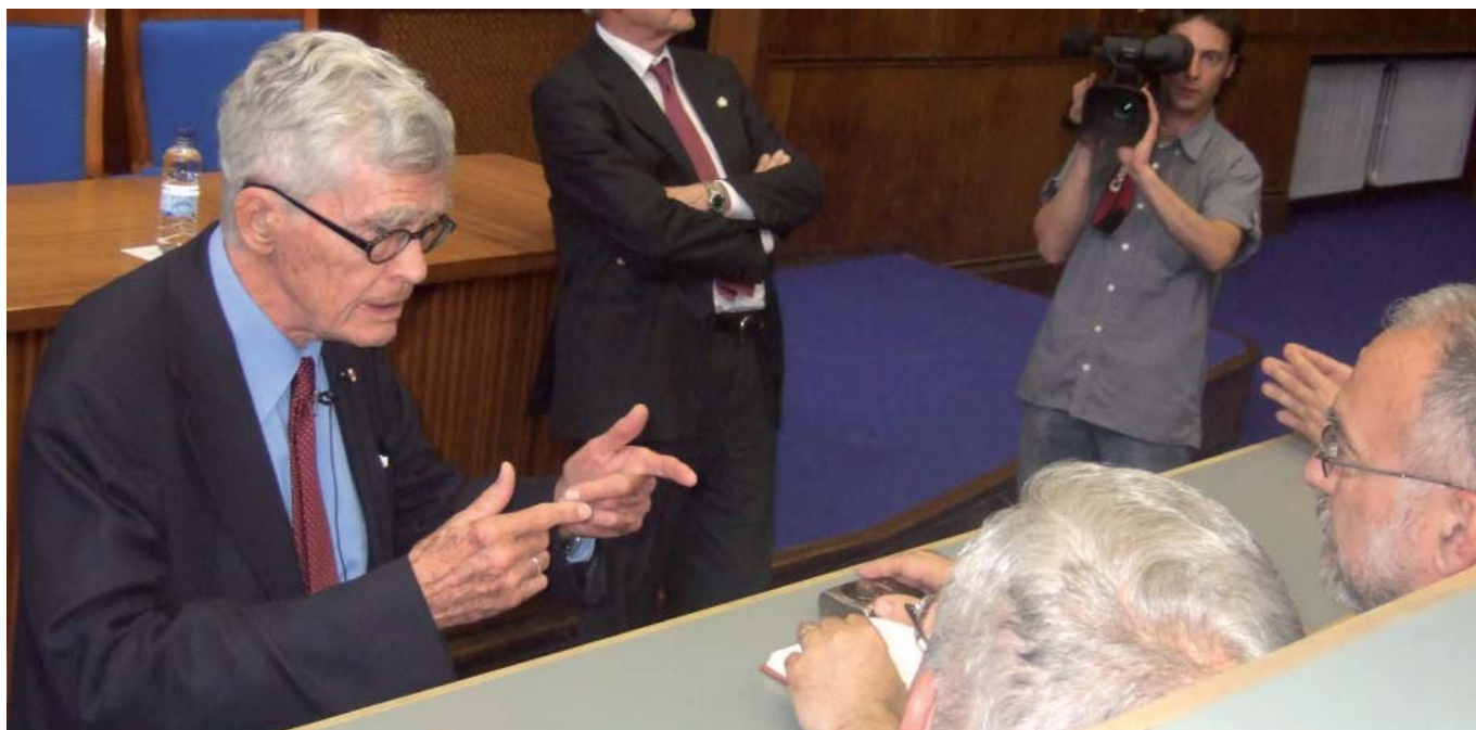
Mario Bunge debate con el público durante una de sus conferencias en el Aula Magna de la Universidad de Zaragoza.