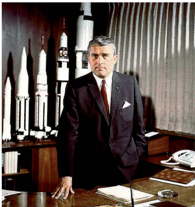
von Braun en su despacho de la NASA en 1964

La habilidad del autor es que no se centra sólo en estos héroes y las repercusiones tan distintas que para ellos tuvieron sus viajes, sino también en muchos otros personajes como los comandantes del módulo de mando, aquellos miembros del equipo que tuvieron que quedarse solos en órbita lunar mientras sus compañeros disfrutaban