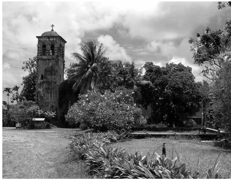
Izquierda: Restos de los muros del Forte Alfonso XIII en el centro histórico de Kolonia, capital de Pohnpei. Construido en época de dominación española y mantenido posteriormente por el gobierno colonial alemán debido a las frecuentes revueltas de la población.