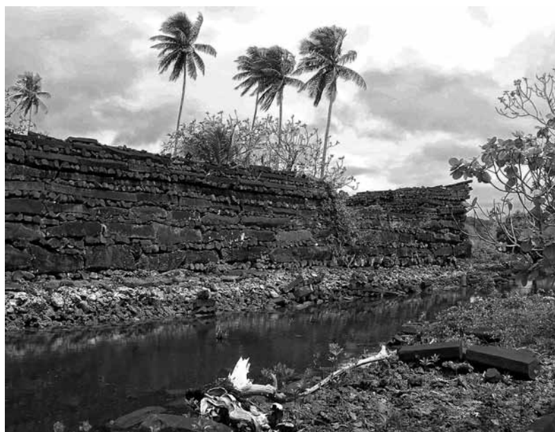
Izquierda: Entrada al complejo monumental de Nandauwas (Nan Madol), situada en el muro occidental, construido con bloques prismáticos de basalto de origen natural apilados. Tras la primera abertura puede verse también parte del muro interno y la entrada de la tumba central al fondo. El muro a la derecha de la abertura tiene entre 5 y 6 metros de altura.