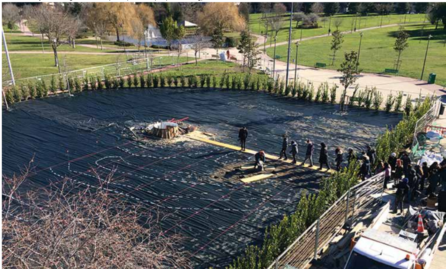
Plantación del jardín de la galaxia en Pamplona.

La jornada se dividió en cuatro bloques temáticos: Medicina, Fisioterapia, Nutrición/Oncología y Psicología/Psiquiatría, consistentes en unas cuatro o cinco ponencias de unos 10 minutos de duración, seguidas de una mesa redonda en la que se transmitían también a los ponentes preguntas realizadas por el público asistente. Tuvo una fuerte repercusión en medios y en redes sociales. Las grabaciones de las ponencias garantizan una transmisión continuada de los mensajes en YouTube, y los resúmenes aparecen en este número.