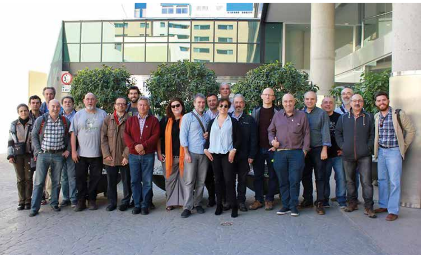
Asistentes a la Asamblea General de Socios de Málaga, abril de 2017