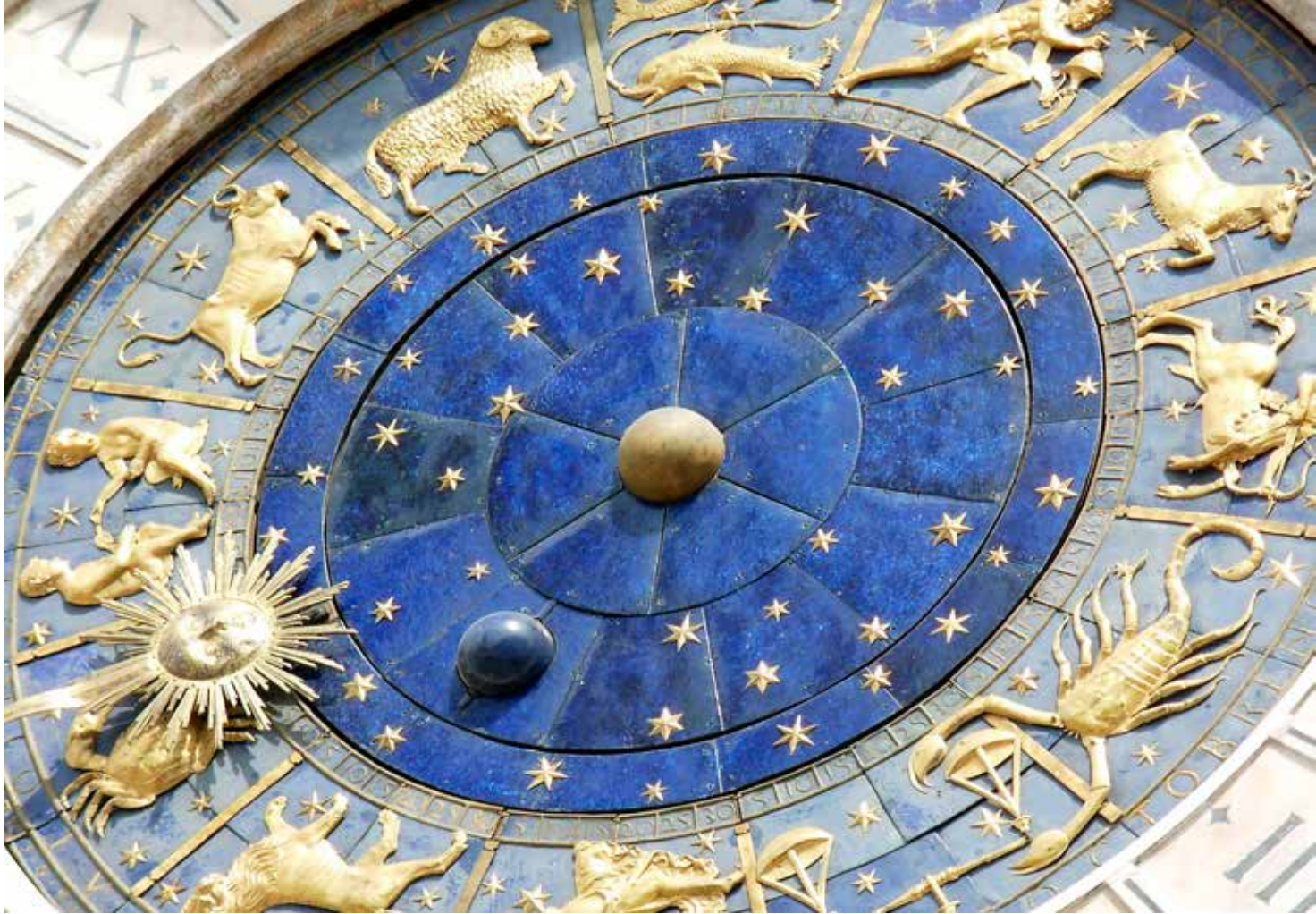
Esfera zodiacal, Venecia - Torre dell'Orologio en la Plaza San Marcos.

los primeros avistamientos de ovnis (caso Kenneth Arnold, junio de 1947) y contactos (caso Roswell, julio de 1947) con los extraterrestres (los nuevos seres numinosos 14 ) transmutados ahora en seres superiores que nos observan, vigilan y escudriñan para, según sus exégetas y, dependiendo de la casuística correspondiente, en unos casos esclavizarnos, explotarnos y esquilmarlos ( démons ), y en otros impedir que esta especie desdichada que es la nuestra se destruya mil veces a sí misma 15 ( deidades ).