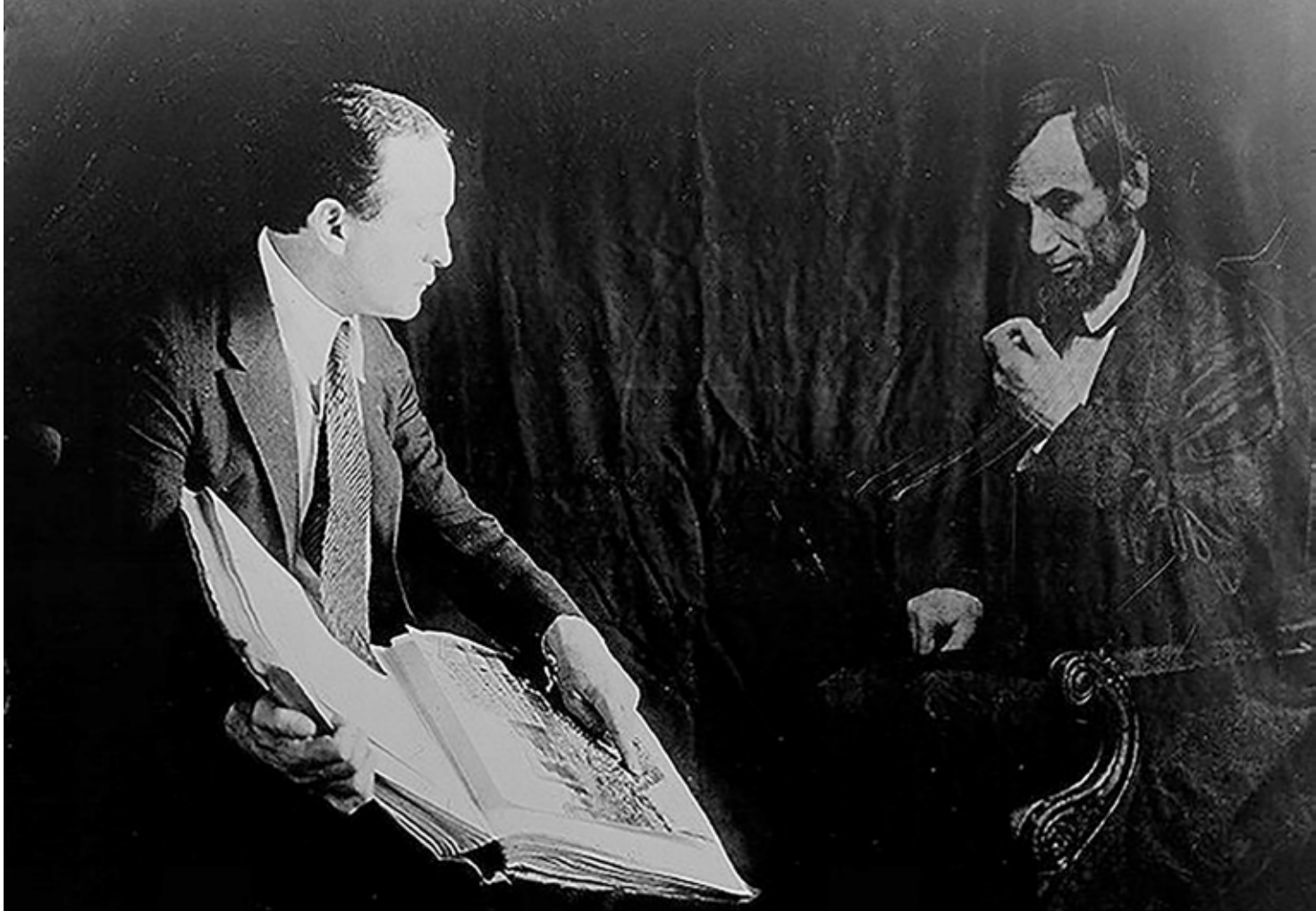
Houdini haciendo «aparecer» el fantasma de Abraham Lincoln.

la información aportada por el joven Erich Weiss 8 con los recuerdos de los presentes, generando la ilusión de estar contactando con el espíritu correspondiente.